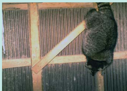
▲ 垂直な壁を降りるアライグマ。すみかや餌を目的に入り込みます。

また、アライグマ回虫、狂犬病などの感染症の媒介によって人やペットへの影響も懸念されます。