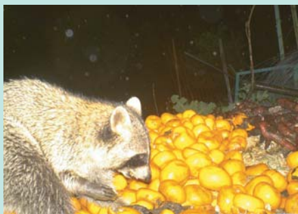
▲ 廃棄ミカンを食べるアライグマ。廃棄する農作物を放置しているとアライグマを呼び寄せる原因となります。

防護壁や防護ネットを設置していても、それらを登って侵入するため、新たな防除対策が必要となります。