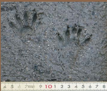
湿地に残ったアライグマの足跡。 ◀ 左：前足 右：後ろ足

森林の水辺を好み、農耕地や市街地周辺にも出没します。特にため池の流入部、樹林内の湿地や溪流などで多く確認されています。夜行性で昼間は暗い所に隠れているためあまり目撃されることはありません。行動圏は 40～100ha とされています。