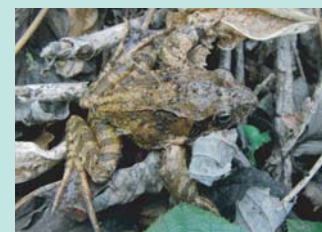
▲ ヤマアカガエル 日本固有種。平地から山間部に生息し、池沼・湿地の浅いところに産卵します。

また、他の動物に対して感染症や寄生虫を媒介する可能性があり、希少な野生動物の減少など、日本の生態系へ重大な被害をもたらすことが懸念されています。