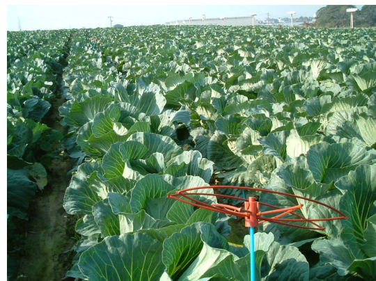
図3 野菜での使用例