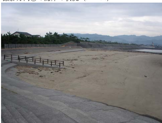
撮影方向②の海岸の状況 (広角)