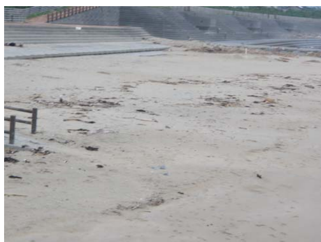
撮影方向②の海岸の状況 (ズーム)