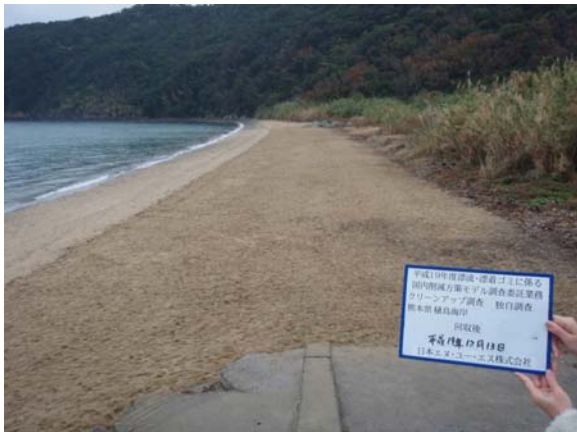
12月13日（第2回独自調査実施直後）