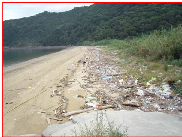
撮影方向①の海岸の状況（広角）