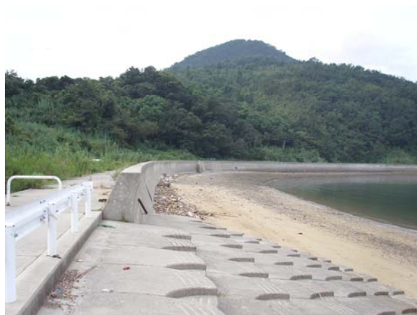
撮影方向②の海岸の状況（広角）