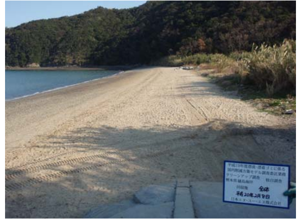
2月8日 (第3回独自調査実施直後)