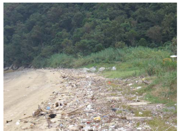
撮影方向①の海岸の状況（ズーム）