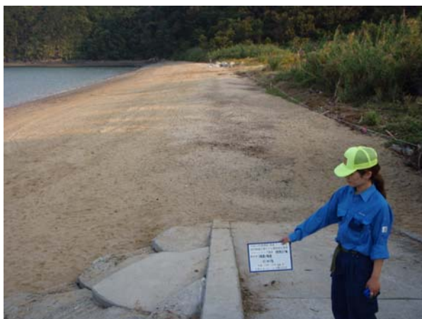
10月26日（独自調査実施直後）