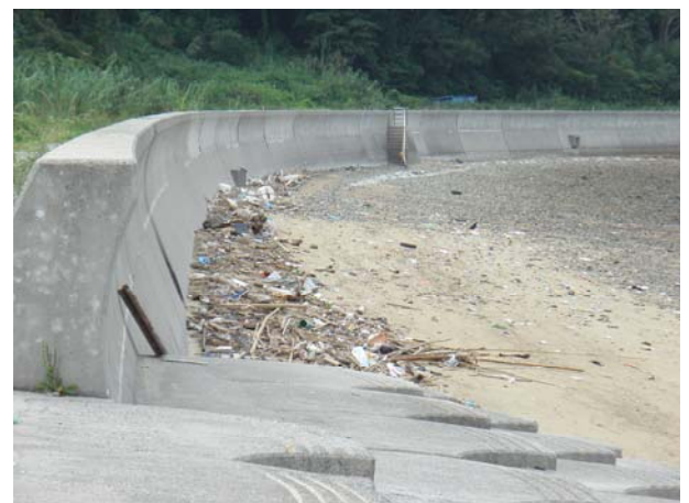
撮影方向②の海岸の状況（ズーム）