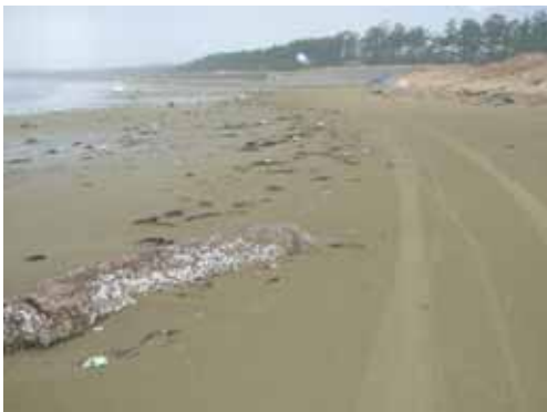
1 月 9 日