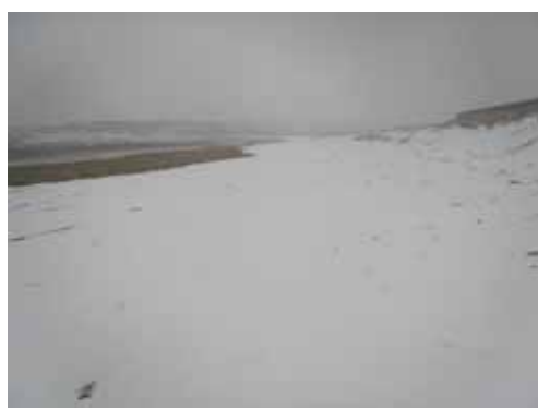
2 月 13 日