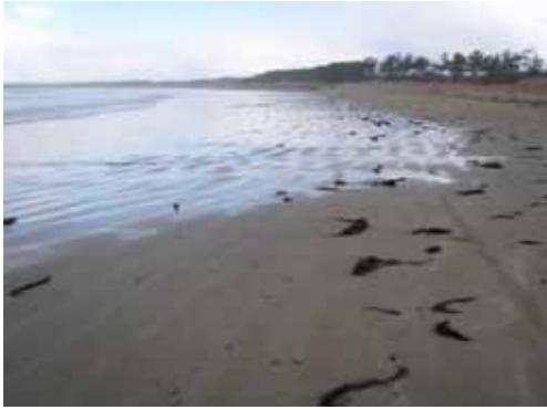
平成 20 年 1 月 2 日