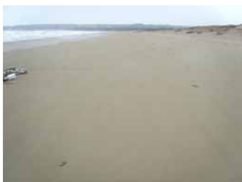
1 月 16 日