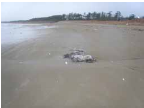
1 月 16 日