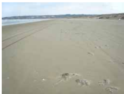
2 月 20 日