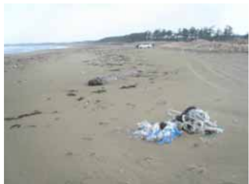
2 月 20 日