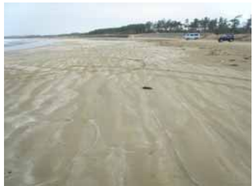
2 月 6 日