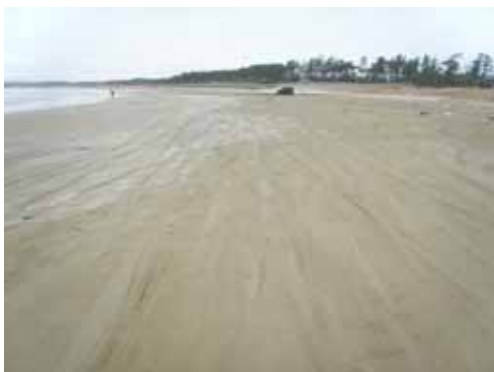
1 月 23 日