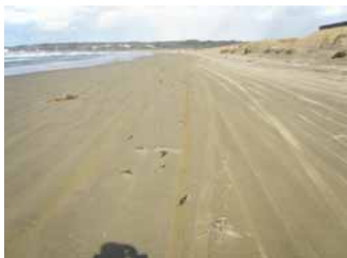
平成 20 年 1 月 2 日