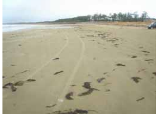
1 月 30 日