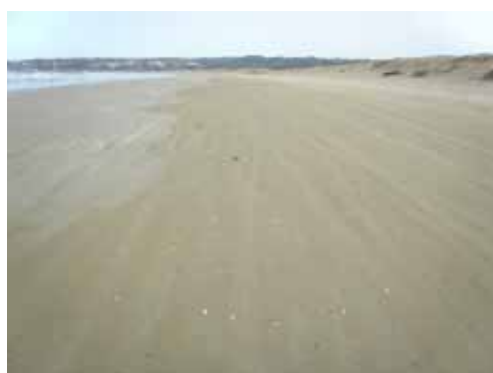
2 月 6 日