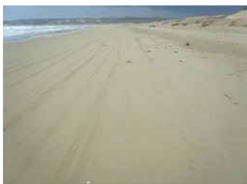
1 月 9 日