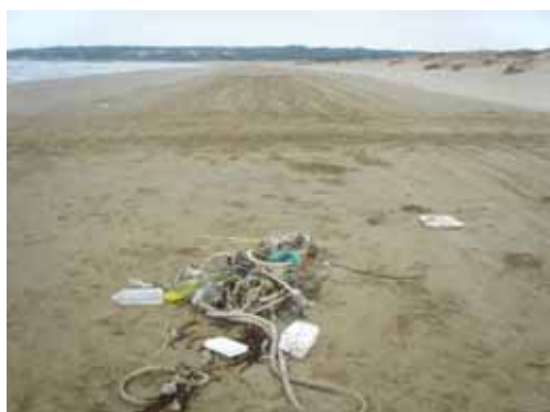
1 月 23 日