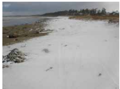
2 月 13 日