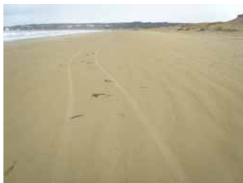
1 月 30 日