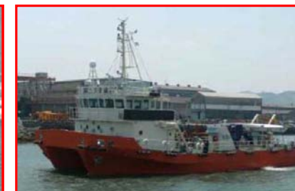
四国地方整備局所属 海洋環境整備船「みずき」 総トン数;154トン