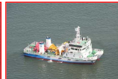
中部地方整備局所属 海洋環境整備船「白龍」 総トン数;198トン