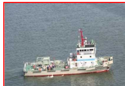
関東地方整備局所属 海洋環境整備船「べいくりん」 総トン数;199トン