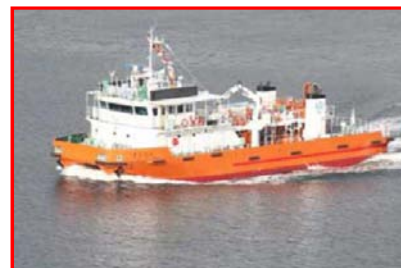
近畿地方整備局所属 海洋環境整備船「海和歌丸」 総トン数;198トン