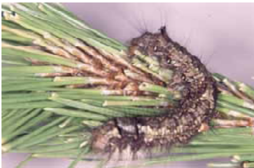
幼虫：成熟幼虫では体長約 70mm

防除方法 :冬の間、幼虫が根際などの狭いところにもぐりこんで越冬する習性を利用して、マツの幹にワラで作ったこもを巻き、越冬のため移動中の幼虫を呼び寄せて、翌年の春にワラごと焼却する。