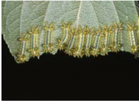
中齢幼虫：トゲが発達する。