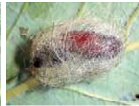
蛹：葉裏や枝に荒いマユを作って蛹化する。