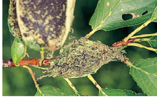
若齢幼虫：若齢幼虫は、はいた糸の上で生活し葉を食害する。