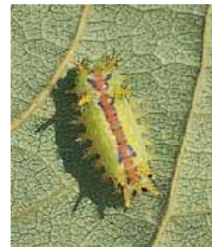
幼虫：成熟幼虫では体長約 18mm

分布や寄生植物はほとんどイラガと同じ。ただし、年2回発生し、幼虫は6～7月と8～9月に見られる。