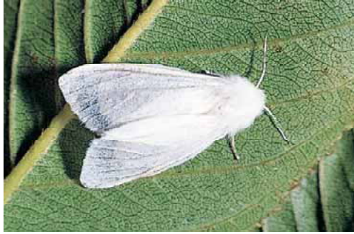
成虫：開張* 22 ~ 36mm