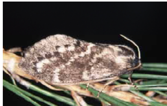
成虫：開張♂ 45～60mm ♀ 70～90mm