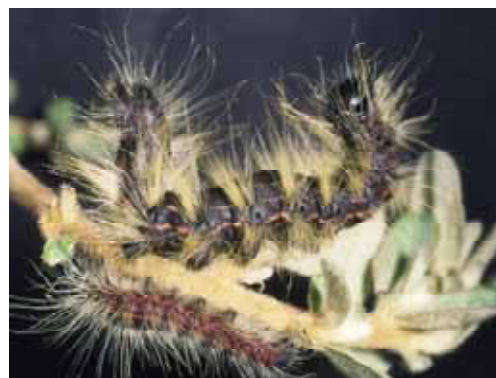
成熟幼虫(上)と中齢幼虫(下): 体色は灰黒色で長い毛がある。成熟幼虫の体長は約 50mm