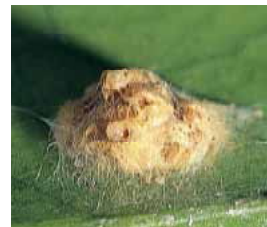
卵塊：葉裏に卵塊を産んだ後に、雌は腹部の毛で覆う。