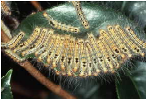
幼虫：集団で加害をする。 中齢幼虫以降分散する。