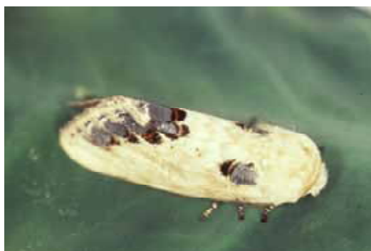
成虫: 開張♂ 46 ~ 54mm ♀ 55 ~ 59mm

防除方法 : 分散前の幼虫を枝ごと切り取る。サクラには生物農薬であるBT剤の適用があり、それ以外の農薬にも適用がある。散布する際は発生樹木に限定して散布する等飛散防止に努める。またサクラには樹幹打ち込み剤も適用がある。