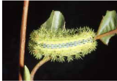
成熟幼虫：背部中央に青い筋がある。