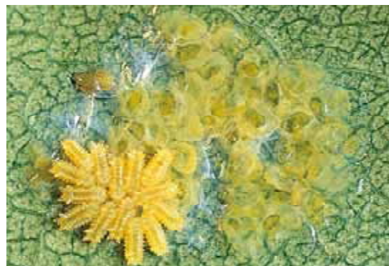
卵とふ化直後の幼虫：葉裏に水をたらしたように卵塊で産む。若齢幼虫期は集合して食害する。