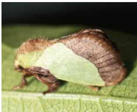
成虫：翅は緑色で前縁は茶色。茶色の部分の幅がアオイラガより広い。

防除方法：幼虫が集合して加害している場合は、寄生部分の剪定など物理的な防除が有効。冬期にマユを確認した場合は掻き取る。