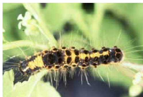
成熟幼虫 : 体長約 40mm