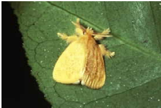
成虫：開張♂ 24 ~ 26mm ♀ 27 ~ 35mm

防除方法：家庭の庭等管理が容易な場所では、冬のうちにたんねんに葉裏の卵塊をさがして除去することも可能。また、幼虫のまだ小さいうちに葉を切り取って踏みつぶしたり、ビニール袋で覆って、枝や葉を切り取って袋に入れるのも効果的な防除法。駆除は風のないときを選び、毒針毛が直接皮膚に触れないようにして行う。また、集団に対して農薬をスポット的に散布することも可能。幼虫が大きくなると集団がいくつにも分かかれ、被害が樹全体に及び、物理的な除去は毒針毛等が人へ付着し危険。ツバキ及びサザンカには生物農薬であるBT剤の適用があり、その他の農薬にも適用がある。使用する場合は、できるだけ飛散しないよう注意を要する。