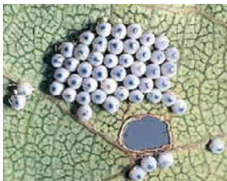
卵塊: 葉裏に数十粒の卵を産みつける。初めは白いがやがて眼点が現れふ化する。