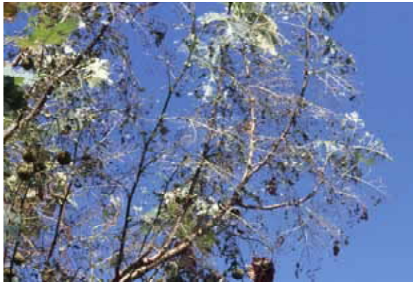
被害の様子（左サクラ 右プラタナス）：サクラ等では中肋を残して丸坊主となることもある。