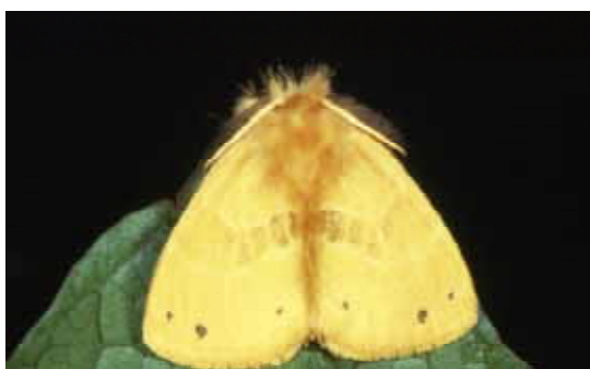
成虫 : 開張♂ 25 ~ 33mm ♀ 37 ~ 42mm

防除方法 : チャドクガに準ずるが、年1回発生であること、幼虫で越冬することから幼虫の発生時期が違うことに注意を要する。