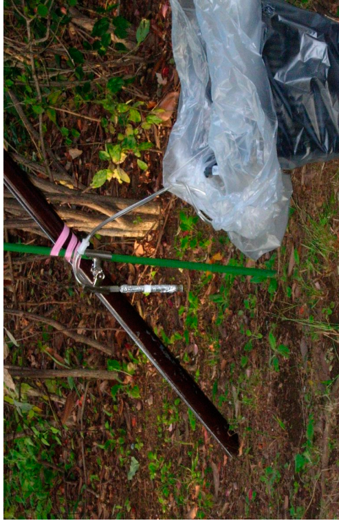
気中濃度調査：地上0.2m