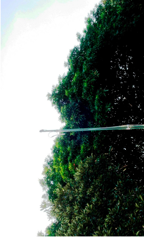
気中濃度調査：樹冠高