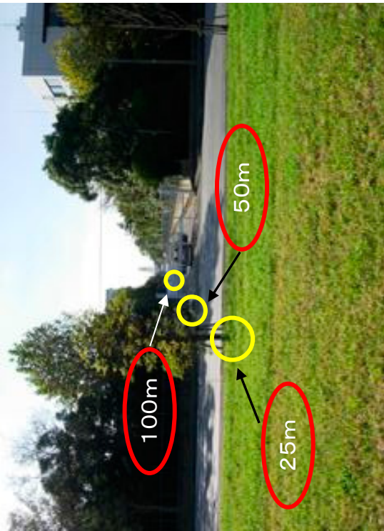
散布区域から見た各調査地点