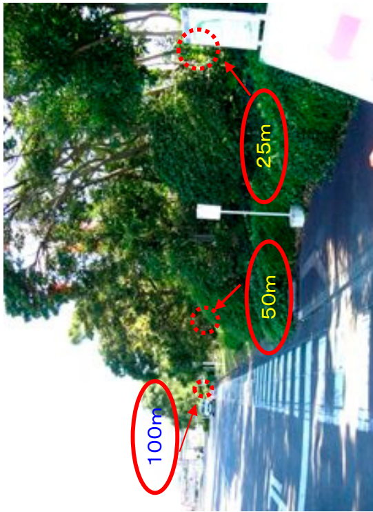
散布区域から見た各調査地点