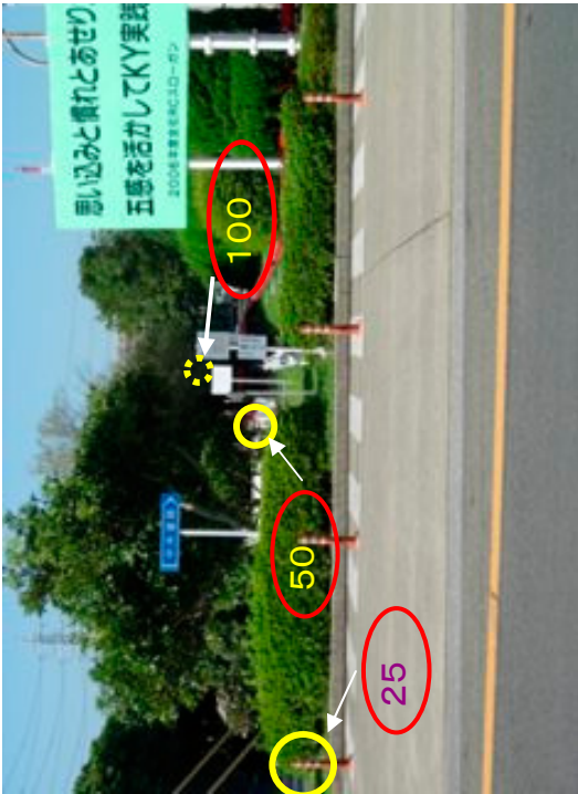
散布区域から見た各調査地点