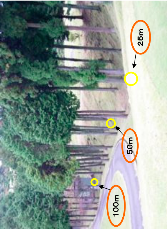
散布区域から見た各調査地点