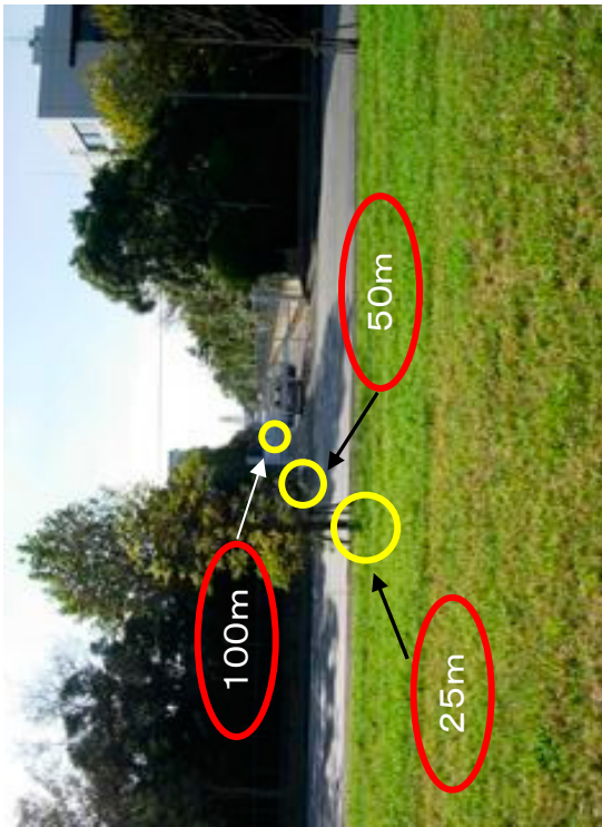
散布区域から見た各調査地点