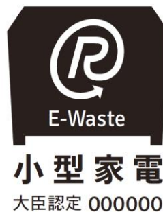
小型家電認定事業者マーク

なお、認定事業者は、次に掲げる小型家電認定事業者マークを使用することができます。当該マークを使用することで、施行規則第 8 条第 1 項第 1 号及び第 2 号を満たすことができます。詳細はマークの使用規定及び利用マニュアルをご確認ください。