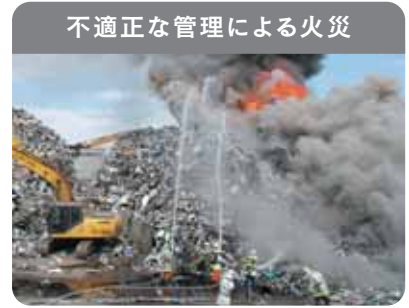
不適正な管理による火災

廃家電は電池やプラスチックを含むため、発火・延焼の危険性があり、不適正な管理による火災が発生しています。