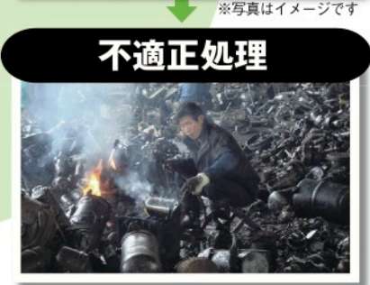
※廃家電の不適正処理の現場（海外）

新しい家電を買ったときに、いちはん悩むのが古い家電の処理方法。粗大ゴミとして出そうとしたら断られるし、「不要品、無料で引き取ります」という業者のチラシをよく見かけるけれど、そういう業者を利用するのはちょっと怖い気がするし……そんな疑問を持っている人は意外と多いもの。普通のごみは分別さえきちんとしておけば、定期的に回収してもらえるので、なんとなく家電製品も回収してもらえるものと考えてしまふのかもしれない。 でも、不要になった家電製品は、普通のごみとは違い「家電リサイクル法」で処理方法が定められています。トラブルに巻き込まれないためにも正しい処理方法を知っておきましょう。