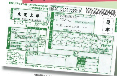
家電リサイクル券（見本）

消費者はリサイクル料金を支払って不要家電を電気店に引き取ってもらい、家電メーカーに渡してもらいます。家電メーカーは責任をもってリサイクルを行います。資源循環型社会の構築に向けて、私たち消費者も重要な役割を担っています。