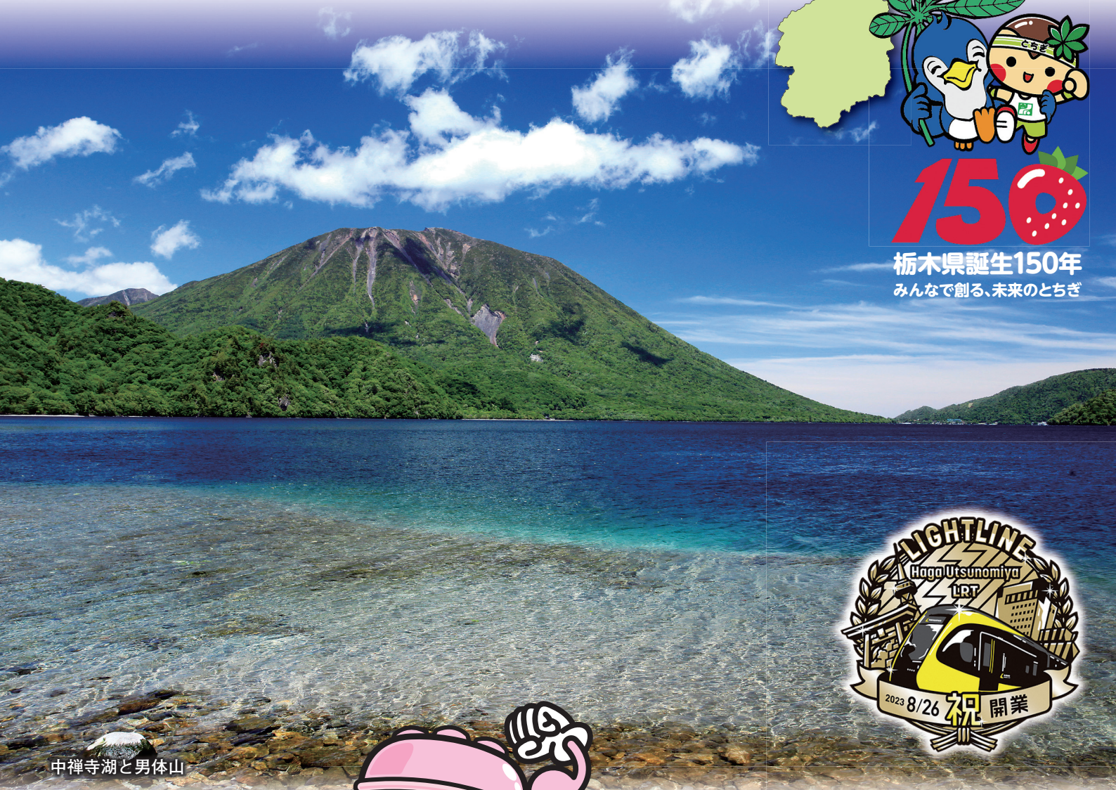
中禅寺湖と男体山