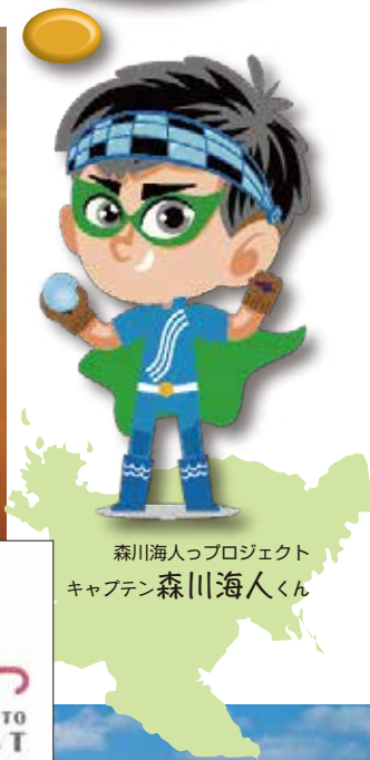
森川海人プロジェクト キャプテン 森川海人くん