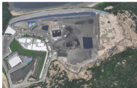
<処分場概要> 投棄等量:約91.3万トン 面積:約6.9万㎡

昭和50年代後半から平成2年にかけて、廃棄物処理業者が許可範囲外の産業廃棄物を大量に搬入し、野焼きや不法投棄を続け、結果として、膨大な量の産業廃棄物が豊島処分地に残された。豊島住民が平成5年11月に県等を相手に公害調停の申請を行い、平成12年6月に調停が成立した。県は、この調停条項に基づき、隣接する直島町に中間処理施設を整備し、焼却・溶融処理による廃棄物等の処理を開始した。