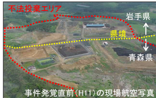
<不法投棄現場状況> 投棄等量:約27万㎡ 面積:約16万㎡