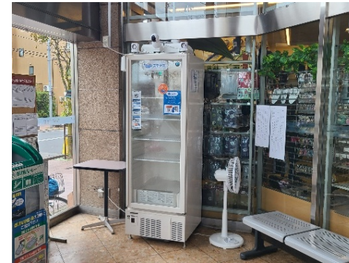
冷蔵庫 設置場所の様子