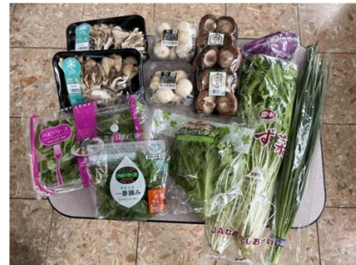
提供する商品の例