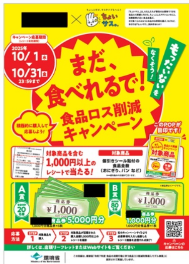
※基本デザインは各社共通