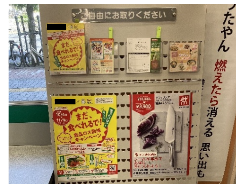
店頭でのキャンペーン展開の様相