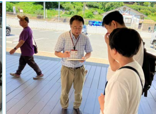
アンケートの実施(観光客)