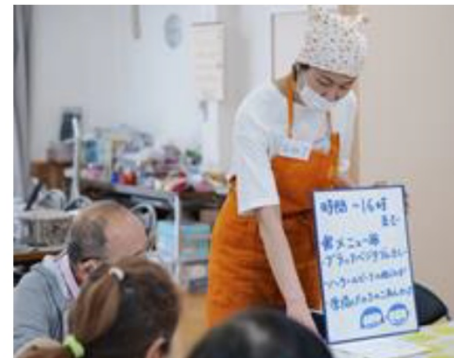
提供先におけるメニュー、アレルギー等の説明