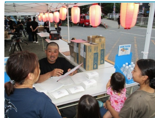
上野村夏祭りでの広報活動