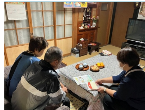
上野村民向け周知活動