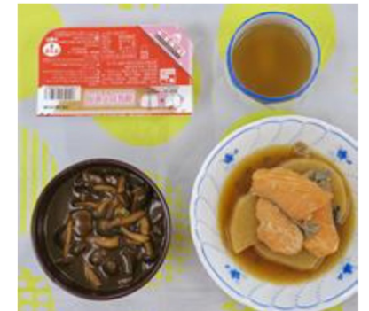
実際に提供された食事の一例