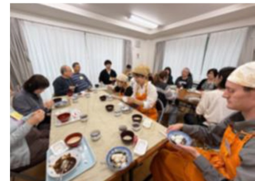
拠点での食事の風景