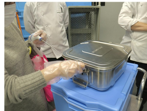
企業側にて温度や品質を確認している様子（拠点でも確認）