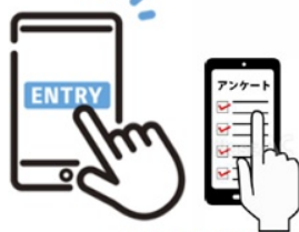
※食品ロス削減に関するアンケートも実施