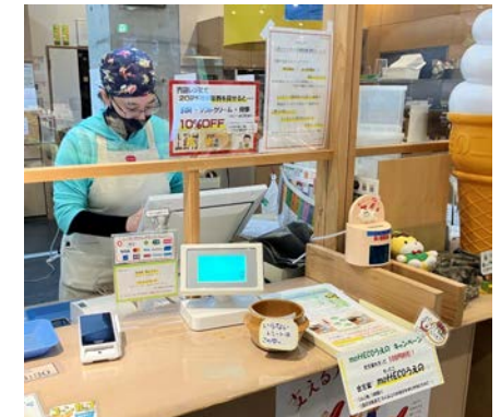
観光客向け周知活動(川の駅)