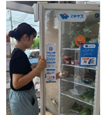
商品受け取りの様子