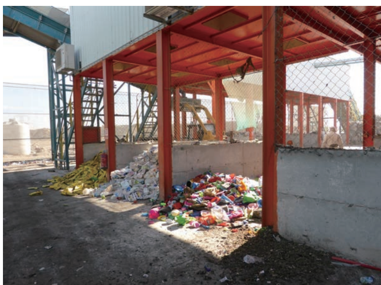
写真-39 2015年1月20日 NCC社リサイクルプラント 分別されたプラスチック類