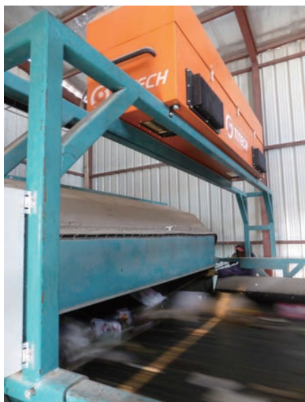
写真-37 2015年1月20日 NCC社リサイクルプラント 光学選別装置(TITECH)