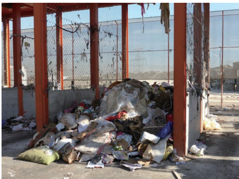
写真-33 2015年1月20日 NCC社リサイクルプラント 選別された粗大物