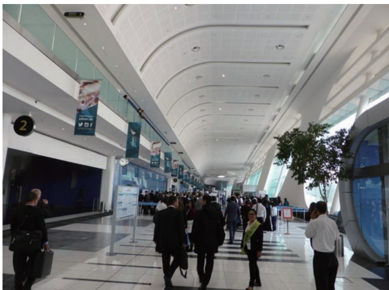
写真-47 2015年1月21日 EcoWaste 2015 (アブダビ) 会場