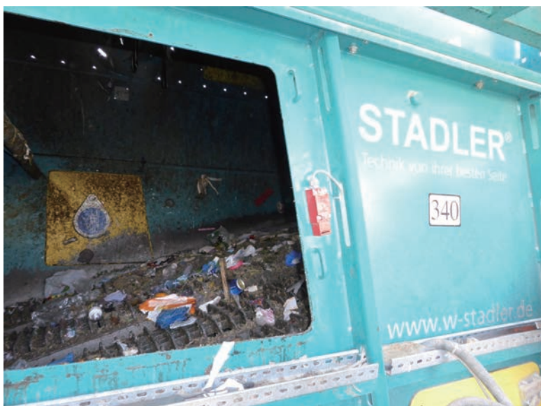
写真-36 2015年1月20日 NCC社リサイクルプラント 振動スクリーン (平面的なものと同立体的なもの を分別)