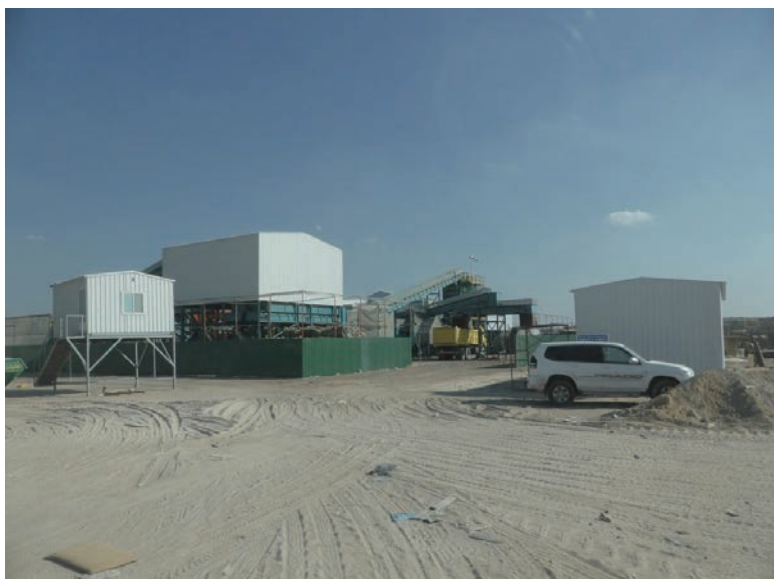
写真-28 2015年1月20日 NCC社リサイクルプラント視察 プラント外観