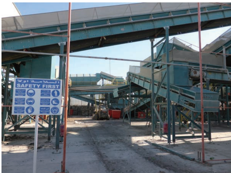
写真-29 2015年1月20日 NCC社リサイクルプラント 敷地内