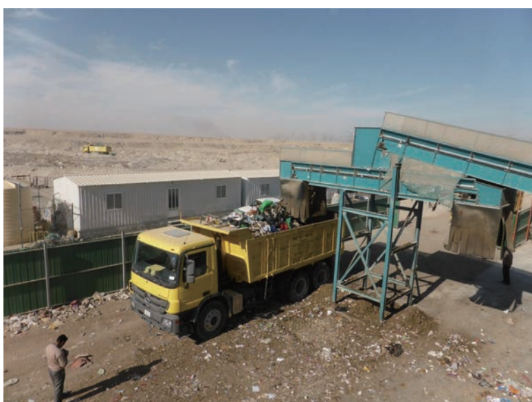
写真-42 2015年1月20日 NCC社リサイクルプラント 不要物を処分場へ積み出し