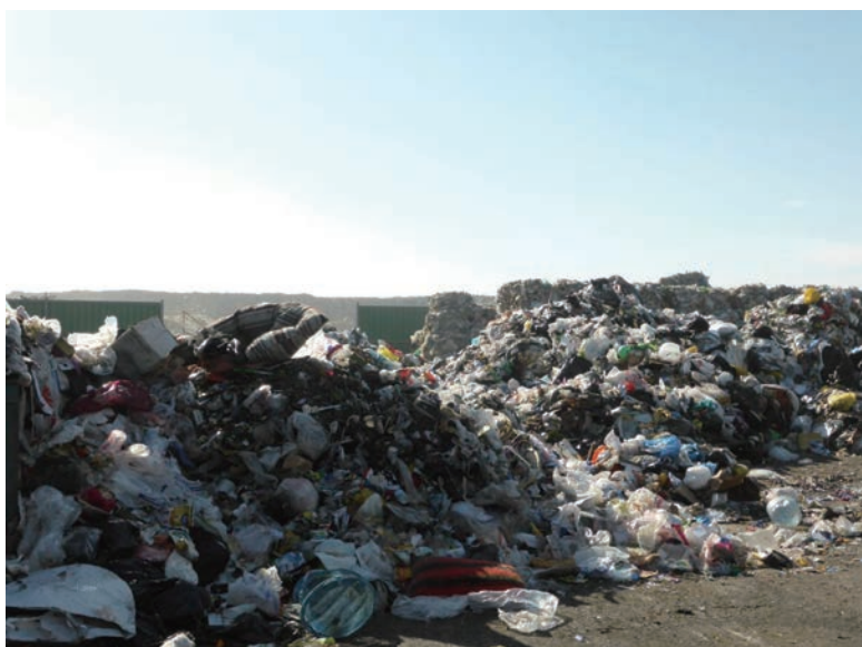
写真-30 2015年1月20日 NCC社リサイクルプラント 投入前の原料