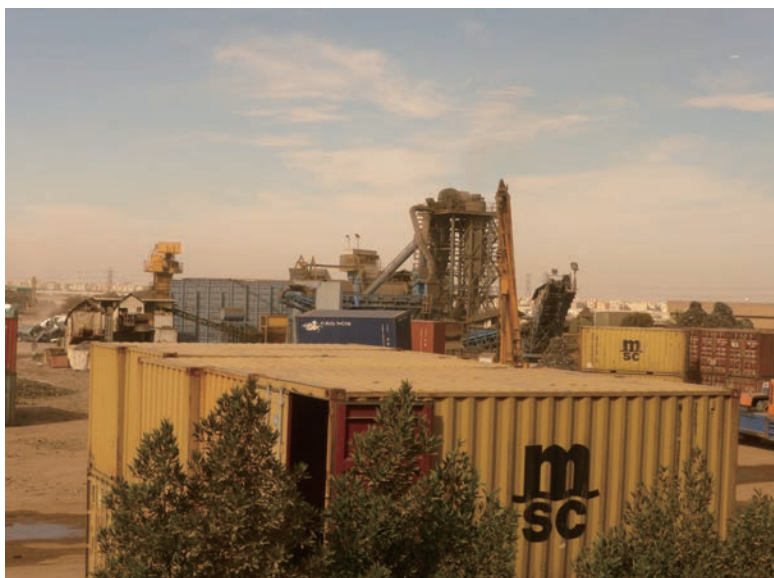
写真-44 2015年1月20日 MRC社 金属破砕機