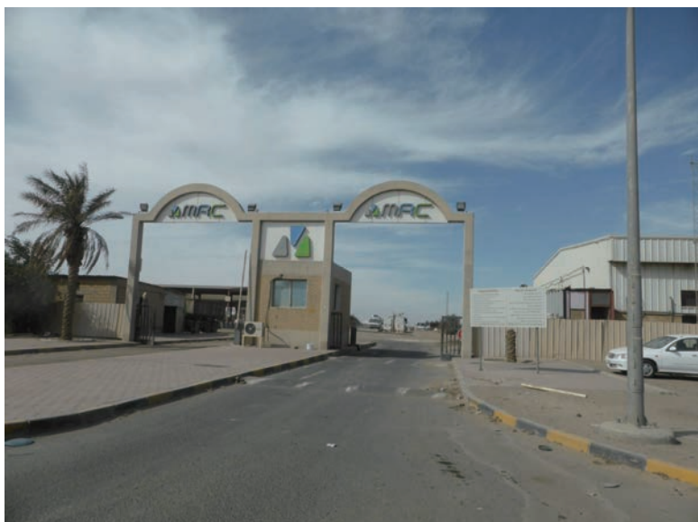
写真-43 2015年1月20日 MRC社