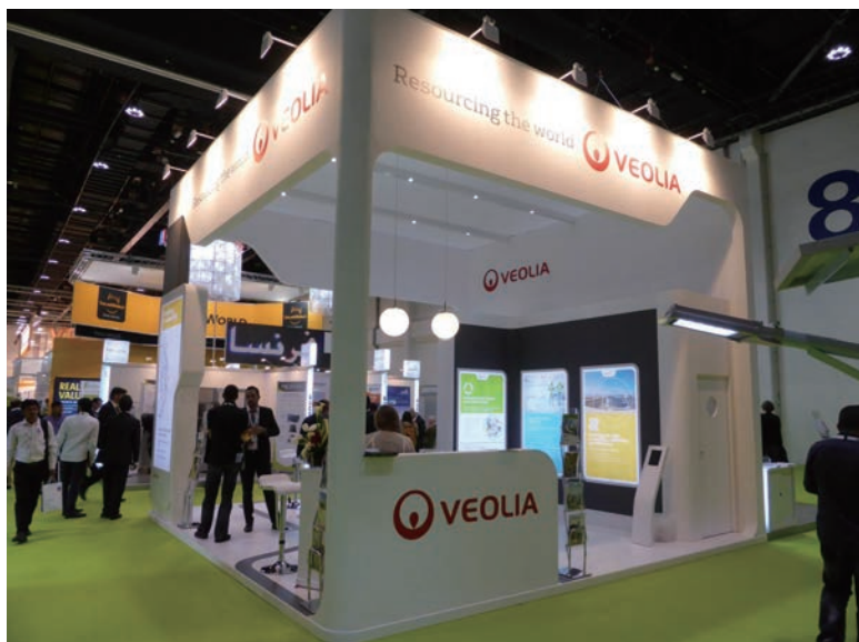
写真-53 2015年1月21日 EcoWaste 2015 (アブダビ) と 同時開催された Energy Summitの、Veolia社のブース