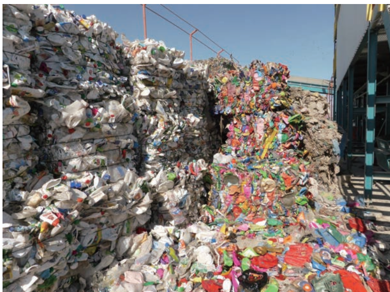
写真-40 2015年1月20日 NCC社リサイクルプラント 梱包されたリサイクル原料