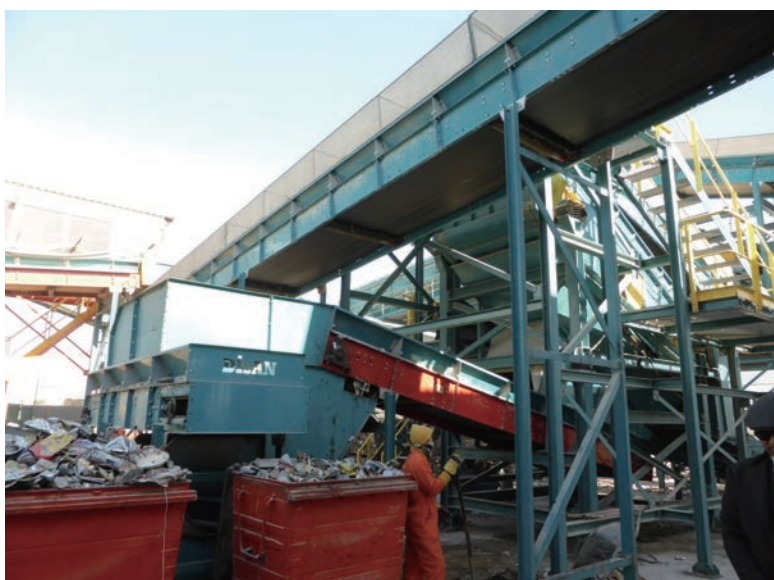
写真-35 2015年1月20日 NCC社リサイクルプラント 金属類選別ライン