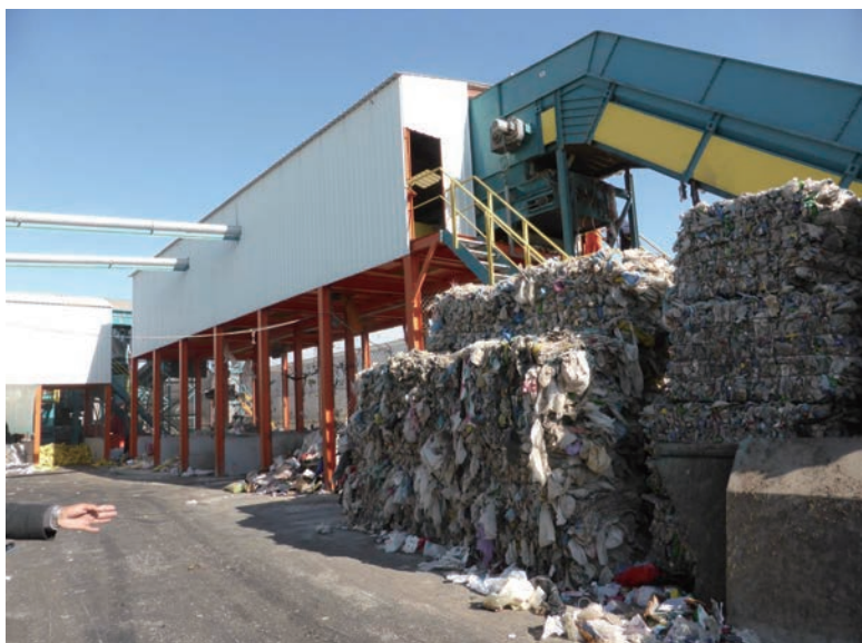
写真-32 2015年1月20日 NCC社リサイクルプラント 原料投入コンベア～粗大物選別・吸気型軽量物選別ライン