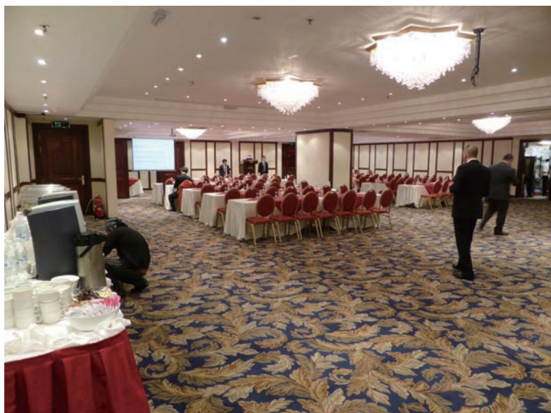
写真-19 2015年1月19日 ワークショップ会場