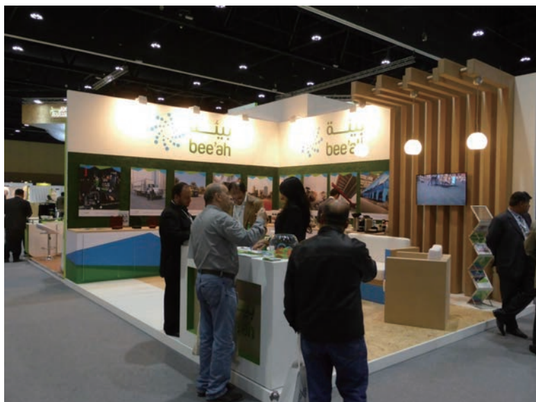
写真-52 2015年1月21日 EcoWaste 2015 (アブダビ) UAEシャールジャ国のbee'ah社 のブース