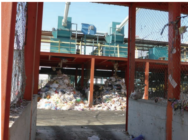
写真-34 2015年1月20日 NCC社リサイクルプラント 吸気型分別で選別され、リサイ クルされずに埋め立てに回る軽 量物