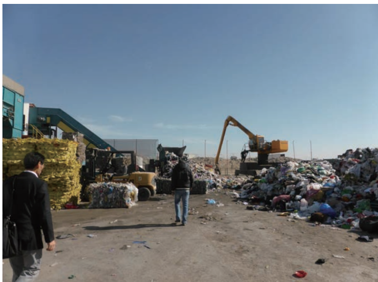
写真-31 2015年1月20日 NCC社リサイクルプラント 原料投入口