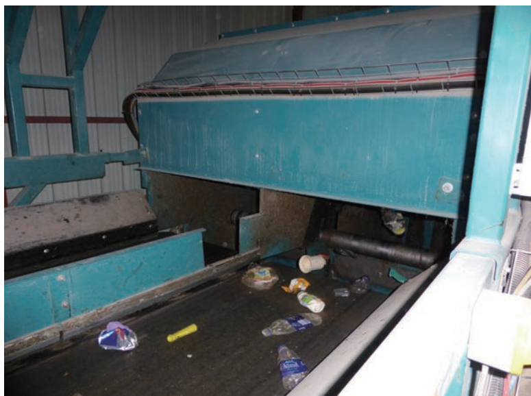
写真-38 2015年1月20日 NCC社リサイクルプラント 光学選別装置(TITECH)