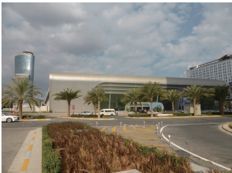
写真-46 2015年1月21日 EcoWaste 2015 (アブダビ) 会場 (National Exhibition Center)