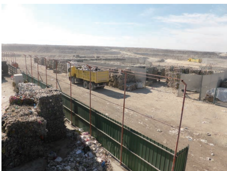
写真-41 2015年1月20日 NCC社リサイクルプラント 出荷されるリサイクル物ヤード