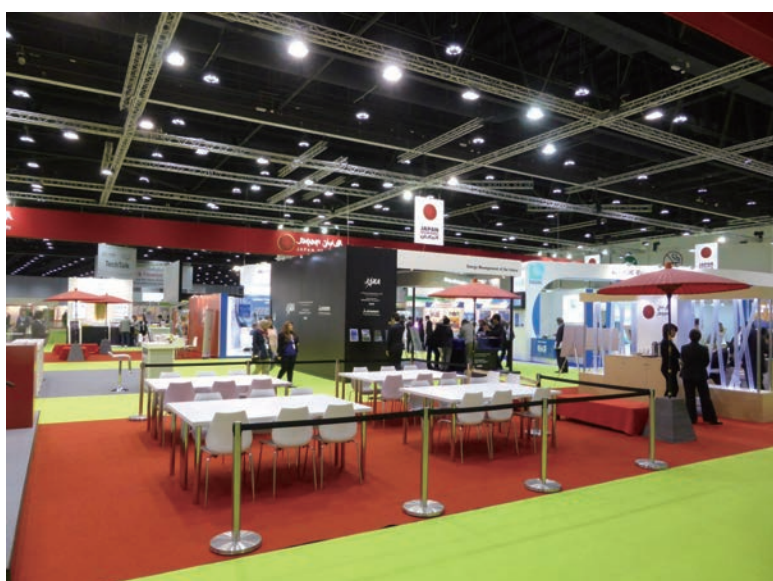
写真-54 2015年1月21日 EcoWaste 2015 (アブダビ) と 同時開催された Energy Summitの、日本企業団のブース