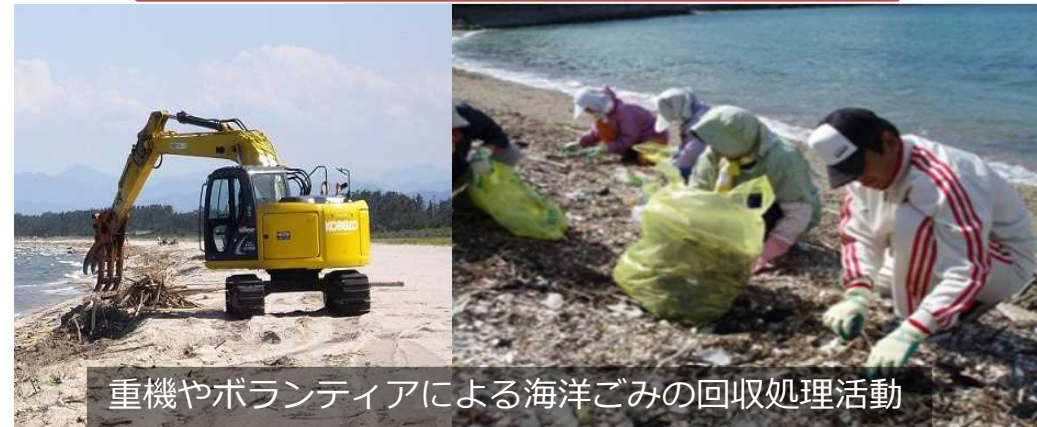
重機やボランティアによる海洋ごみの回収処理事業活動