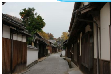
丸亀市塩飽本島町笠島(香川県)