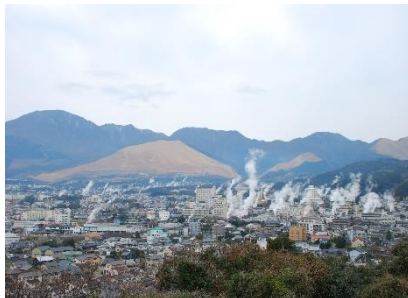
別府の湯けむり・温泉地 景観 (大分県別府市)