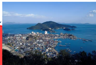
福山市鞆町(広島県)