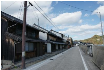
呉市豊町御手洗(広島県)