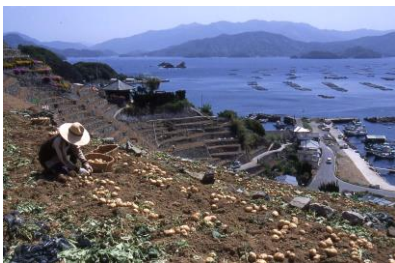
遊子水荷浦の段畑 (愛知県宇和島市)

国は、地方公共団体が行う、① 調査 、② 保存計画策定 、③ 整備 、④ 普及・啓発 の各事業に対して、原則として経費の2分の1を 補助 しています。