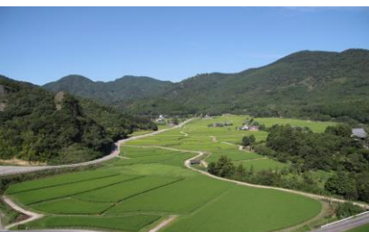
田染荘小崎の農村景観 (大分県豊後高田市)