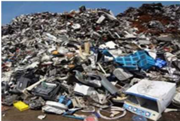
【廃エアコン・廃洗濯機が混入】