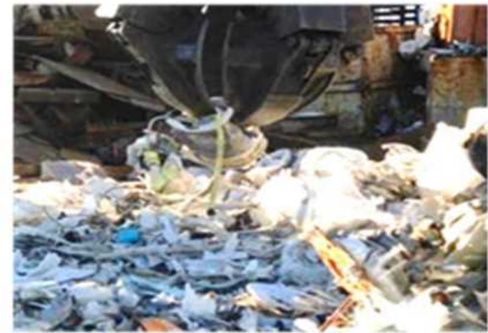
【破碎された洗濯機】