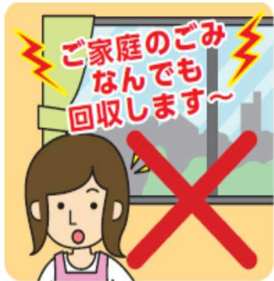
無許可の不用品回収業者