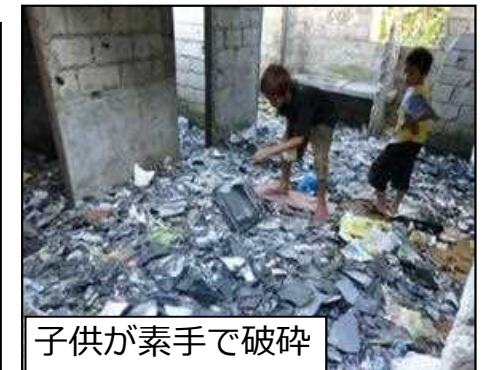
子供が素手で破碎