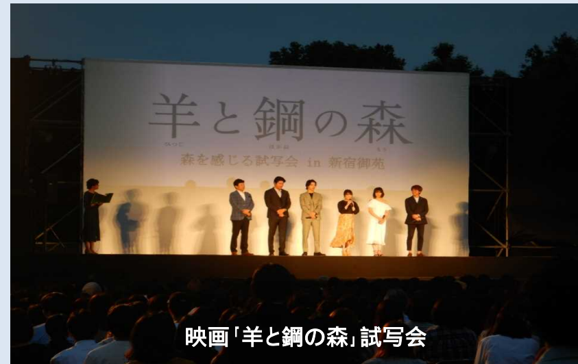
映画「羊と鋼の森」試写会