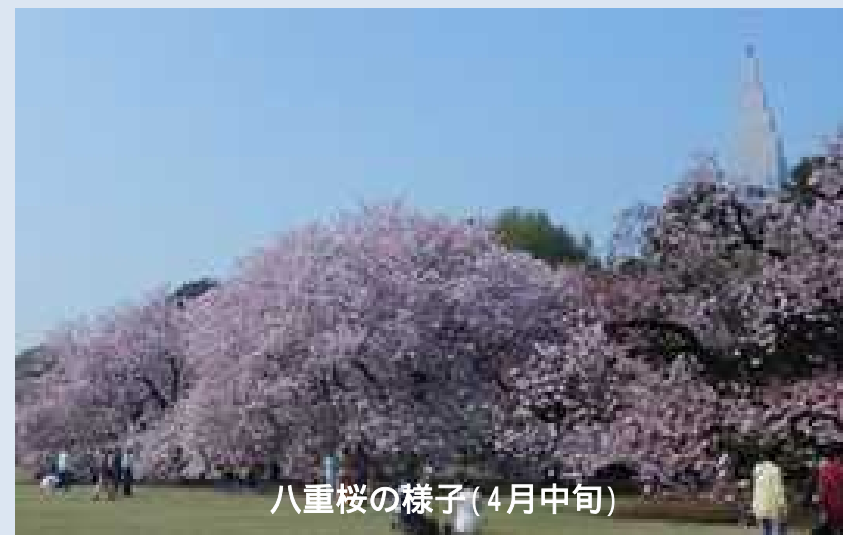
八重桜の様子(4月中旬)