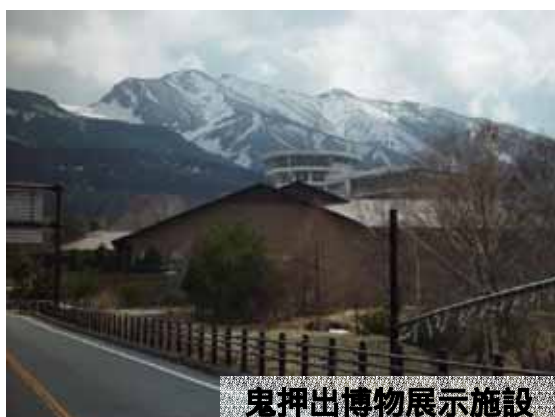
鬼押出博物展示施設