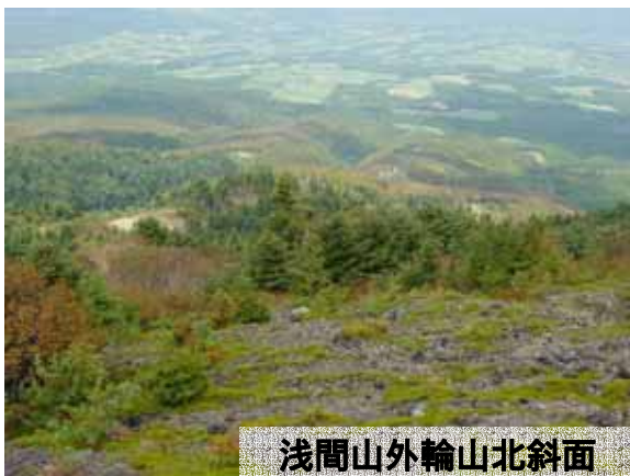
浅間山外輪山北斜面