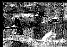
ナベツル[山口県周南市]