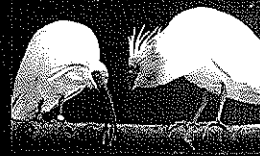
トキ[新潟県佐渡市]