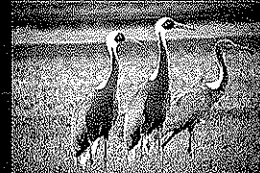
ツル(マナヅル)[鹿児島県出水市]