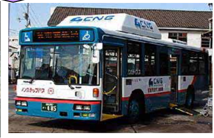
CNGバス等の低公害車の導入