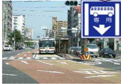
バス専用・優先レーン