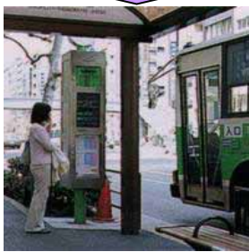
バスロケーションシステム