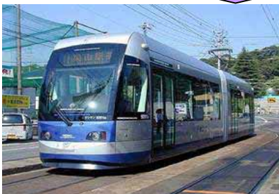
LRTプロジェクトの推進