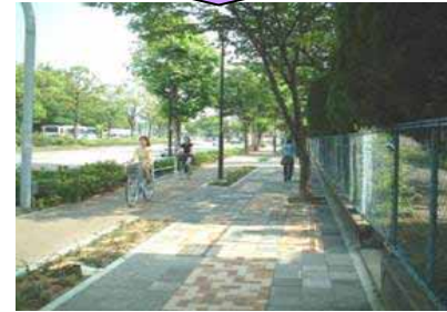
歩道、自転車道の整備