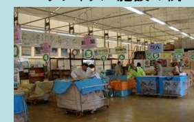
リサイクル施設の例