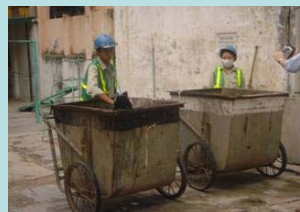
ベトナムでの生ゴミ分別実験