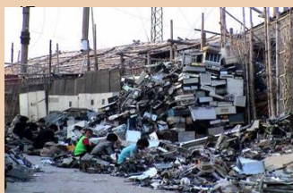
中国におけるE-Wasteの現

途上国で電気電子製品が廃棄物(E-Waste)になった際に、鉛など製品中の有害物質による環境汚染を惹起