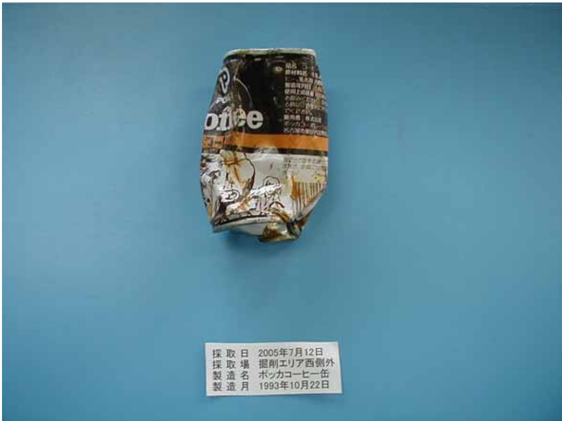
西側の矢板の外側の土壌から確認された飲料用缶