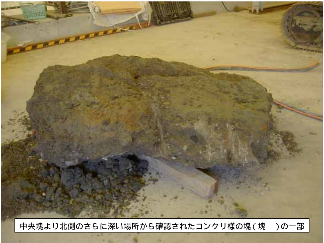
中央塊より北側のさらに深い場所から確認されたコンクリ様の塊（塊 ）の一部