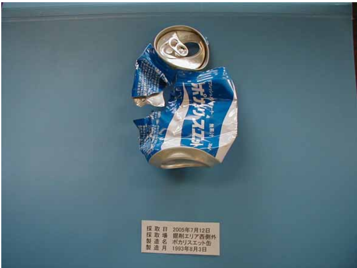
西側の矢板の外側の土壌から確認された飲料用缶