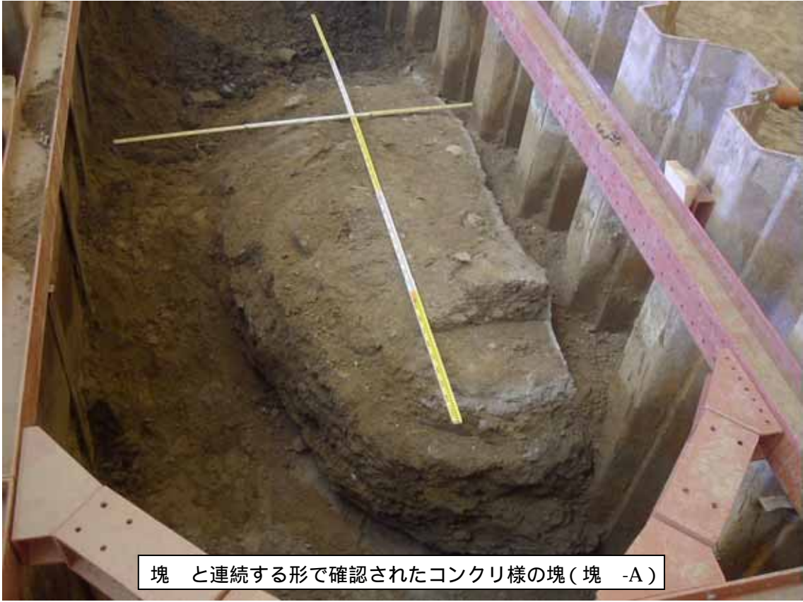
塊 と連続する形で確認されたコンクリ様の塊（塊 -A）