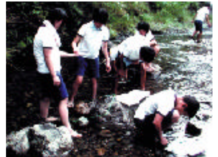
こどもホタルレンジャー活動状況 広川町立津木中学校 (優秀賞受賞)