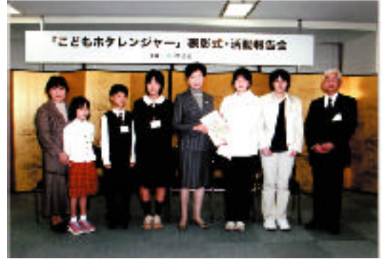
環境大臣賞を受賞した法吉こどもエコクラブ

夜、ちいさく光りながら飛ぶホタルは、水の中で育ちます。汚れてしまった水をきれいにしたり、ホタルのこどもが楽しくらせる川や湖を守るホタルの味方。それが「こどもホタルレンジャー」です。日本で多くみられるゲンジボタルやヘイケボタルは、一生のほとんどを水辺で過ごす生き物です。ホタルを守ろうとする活動を通じて、特に次世代を担う子どもたちが、川や湖の生きものに触れ、これを自らの手で守ることのよこびを感じ取ってくれることが望まれます。このような活動の報告を募集し、全国の代表的な活動やユニークな活動を環境大臣が表彰します。表彰対象団体には、表彰式と活動報告会にご招待します。たくさんの報告をお待ちしています。