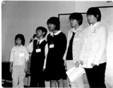
環境大臣賞 法吉こどもエコクラブ（島根県）