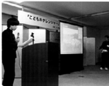
優秀賞 松崎中学校ゲンジボタル 保護ボランティア（静岡県）