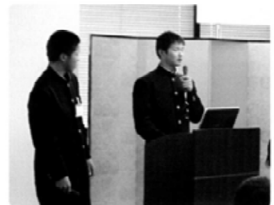
優秀賞 津木中学校環境整備委員会 ゲンジボタル保護班（和歌山県）