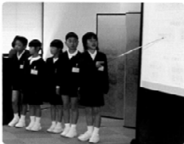
優秀賞 高梁市立福地小学校 （岡山県）