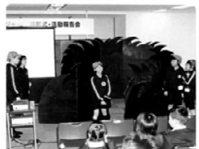
優秀賞 辨山子どもホテル団 （兵庫県）