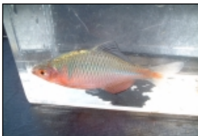
ニッポンバラタナゴ 絶滅危惧ⅠA類