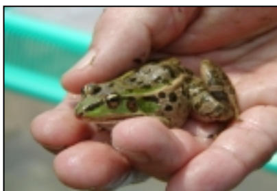
ダルマガエル 絶滅危惧Ⅱ類