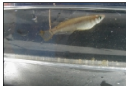
メダカ 絶滅危惧Ⅱ類