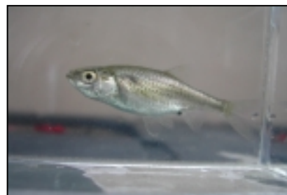
カワバタモロコ 絶滅危惧ⅠB類