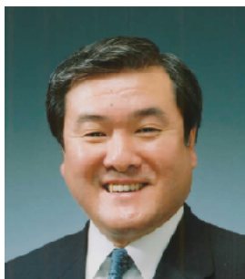
環境大臣 鈴木 俊一

今、私たちは、地球温暖化問題、廃棄物問題など、様々な課題の解決を迫られています。