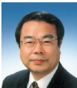
環境大臣政務官 望月 義夫

富士山や南アルプスの雄大な自然環境に恵まれた静岡で、ともに環境について語り合う「環境省タウン・ミーティング in 静岡」に、ぜひご参加ください。