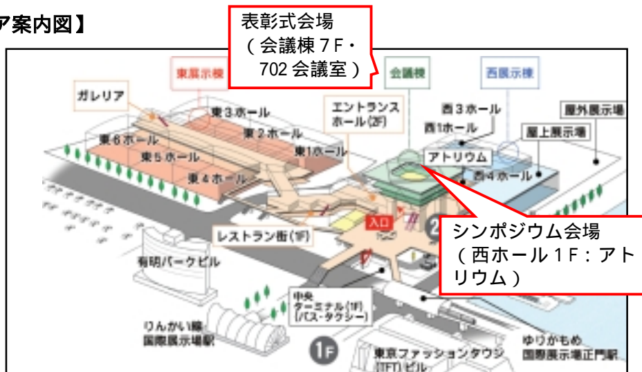
シンポジウム会場（西ホール 1F：アトリウム）