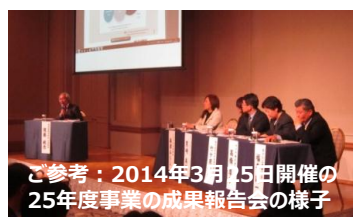
ご参考 : 2014年3月15日開催の25年度事業の成果報告会の様子