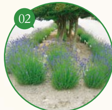
02 街路樹の足元にラベンダー。 ハーブの香りを楽しむ街づくり ▶平成20年度 日本アロマ環境協会賞受賞