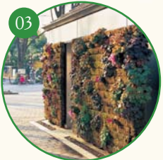
03 公園施設を壁面緑化。 植物の香りで癒しとくつろぎを提供 ▶平成19年度 におい・かおり環境協会賞受賞