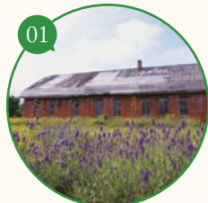
01 「香りとさえずりの杜」 野鳥の集まる市民の憩いの場所へ ▶平成19年度 環境大臣賞受賞

コンテストは、今年度で 8回目をむかえます。 毎年多彩なアイデアが満載。 募集企画のイメージと、 過去の受賞例の 一部をご紹介します。