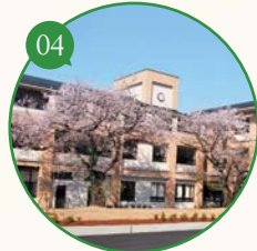
04 「源氏物語」ゆかりの花々が香る学校。 生徒が育て、近所の方も香りを楽しめる ▶平成22年度 環境大臣賞受賞