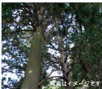
被災地J-VER等のクレジット 写真はイメージです

第一カッター興業株式会社はウォータージェット工法によるコンクリート床版はつり工事（床版はつり工事）に使用する建設機械から排出されるCO2を被災地J-VER等を活用してオフセットします。本取組を被災地を中心に、全国各地で実施する工事に導入することで、社会基盤整備と地球環境保全の両方を実現できる街づくりの普及を目指すウォータージェット施工業界初の取組です。