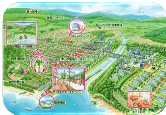
平成 18 年版環境白書より抜粋