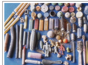
海鳥のヒナ3羽の死骸から発見されたゴミ