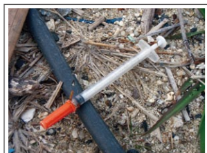
海岸に流れ着いた医療系廃棄物