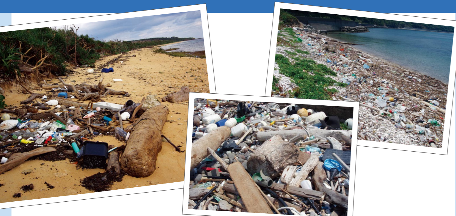
海岸に流れ着いたゴミ