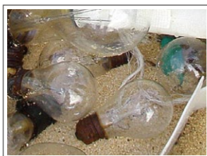
電球。割れているものもある