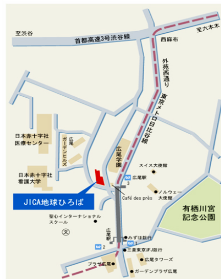
【交通案内】東京メトロ日比谷線 広尾駅下車(3番出口)徒歩1分