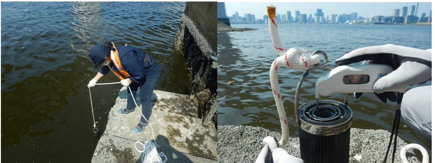
海上保安庁海洋情報部