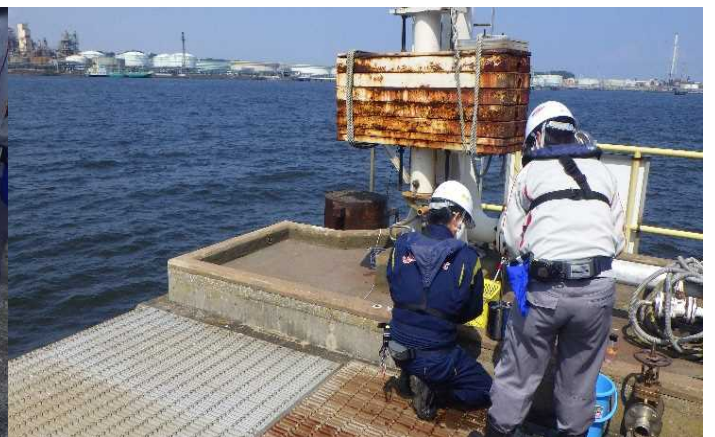
電源開発株式会社 磯子火力発電所