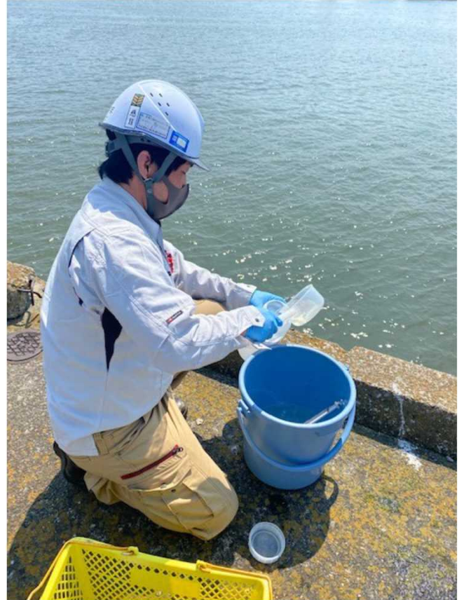
株式会社東芝 横浜事業所