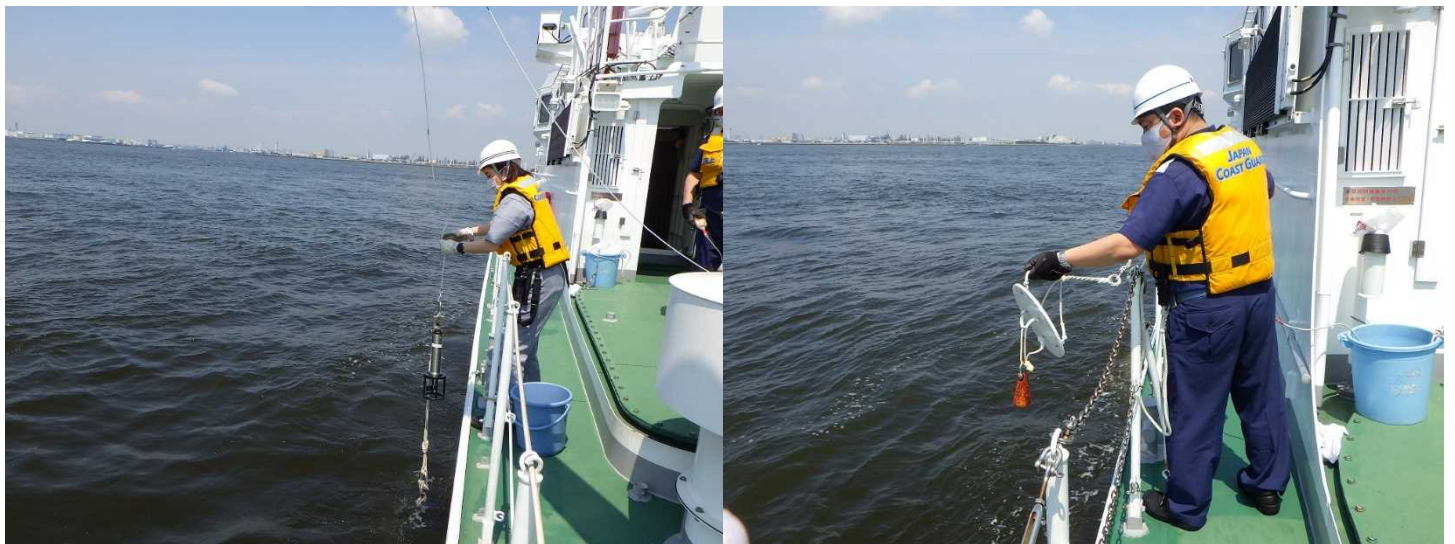
海上保安庁第三管区海上保安本部