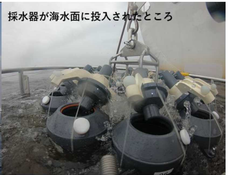
採水器が海水面に投入されたところ