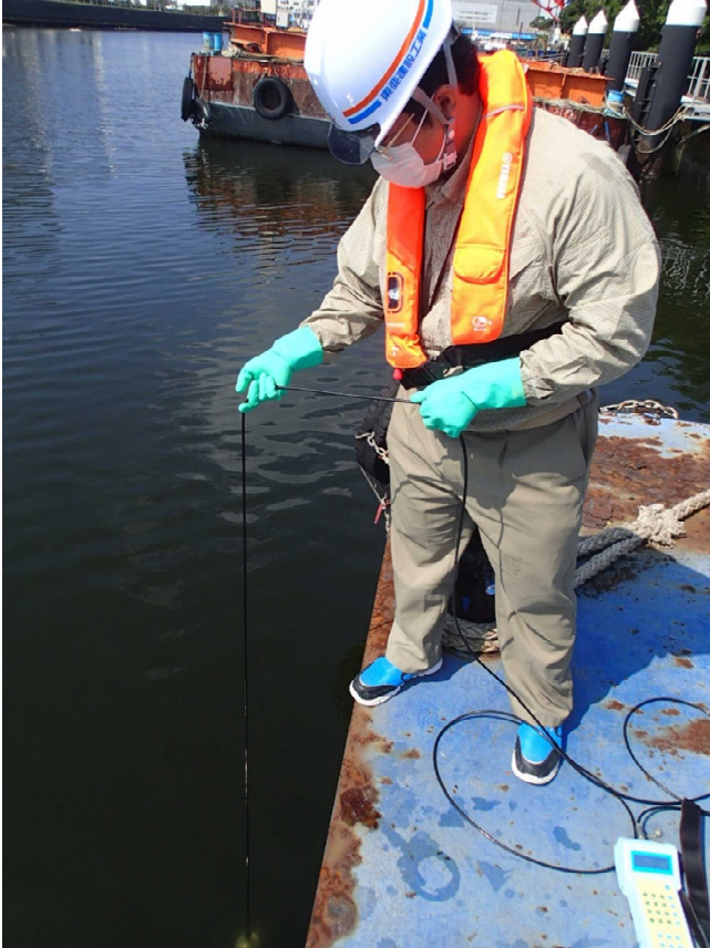
東亜建設工業株式会社

東京湾環境一斉調査参加機関から提供いただいた調査風景写真等を紹介いたします。ご協力ありがとうございました。