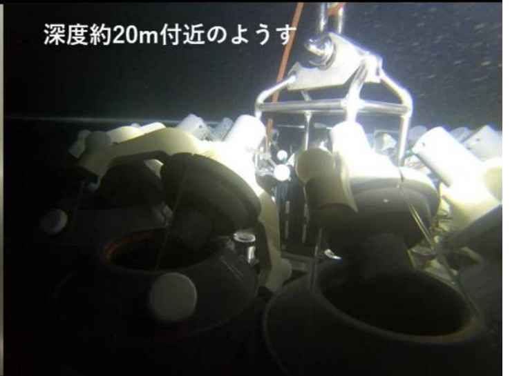
深度約20m付近のようす