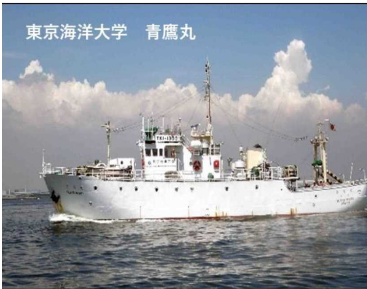
東京海洋大学 青鷹丸