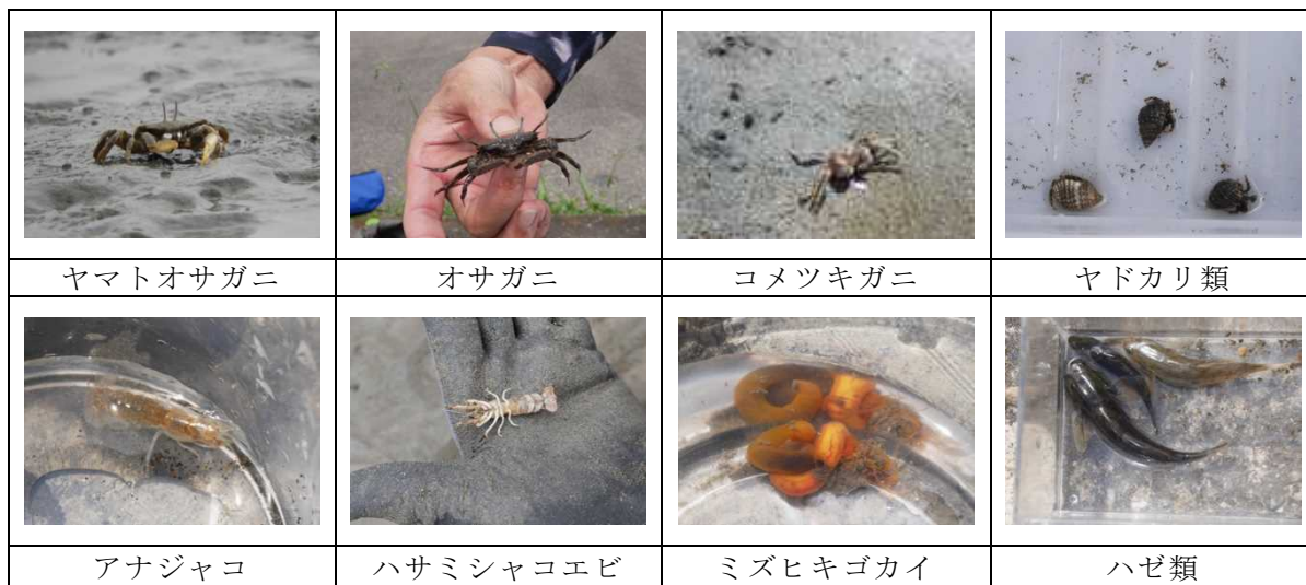
東京湾の干潟でみられた生物の例