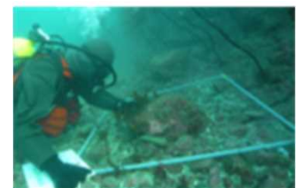
▲藻場の再生・創出の一例