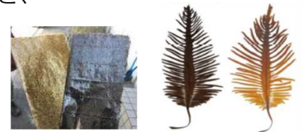
▲色落ちしたノリ（左側）・ワカメ（右側）

※ 栄養塩類の不足の他、気候変動による水温の上昇によって増加した大型の珪藻との栄養塩類を巡る競合も色落ちの一因。