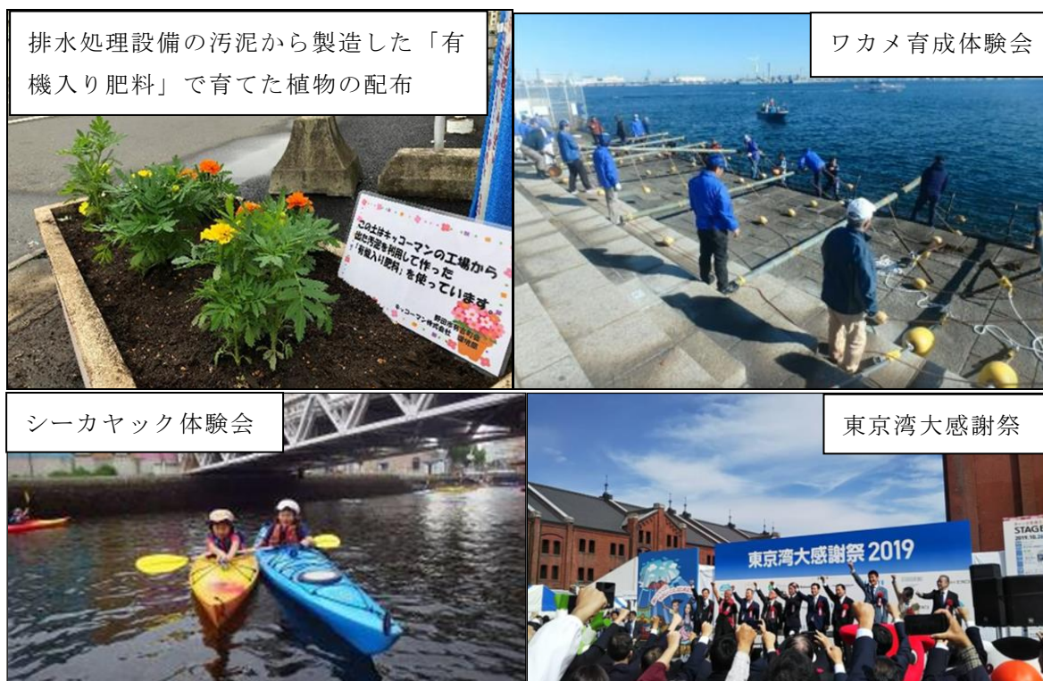
排水処理設備の汚泥から製造した「有機入り肥料」で育てた植物の配布

水辺の自然に親しみを持ってもらうことを目的としたイベントが19件報告されました。