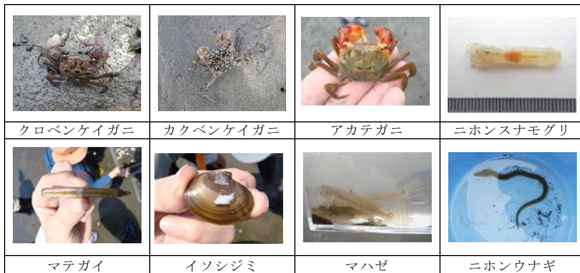
東京湾の干潟でみられた生物の例