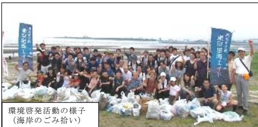
環境啓発活動の様子 （海岸のごみ拾い）