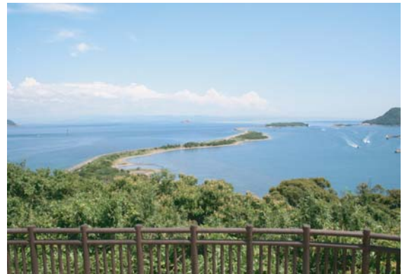
成ヶ島 (成山より望む)

兵庫県洲本市塩屋1丁目1-17 *アクセス方法は裏面参照 ★参加者には、エコバックなどのプレゼントがあります。