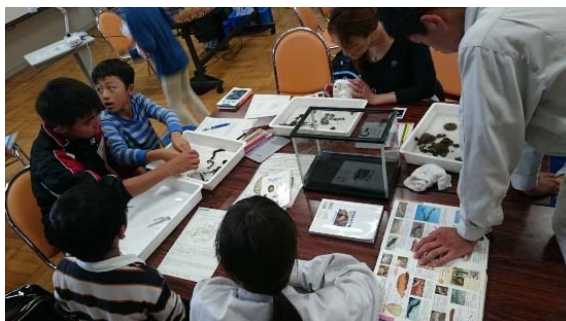
愛媛南予環境シンポジウム・環境学習の様子（昨年度）