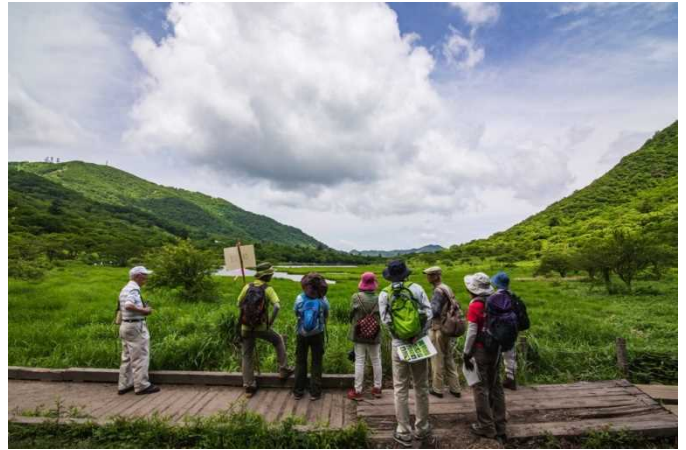
赤城山覚満淵自然観察会