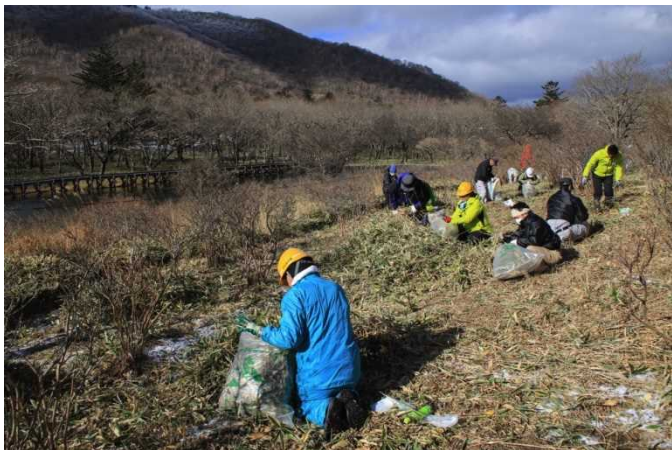
赤城山覚満淵「ササ刈り作戦」