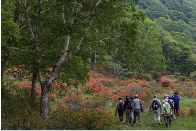
赤城白樺牧場ツツジ散策ツアー