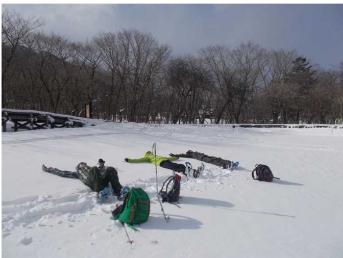
赤城山スノーシューハイキング