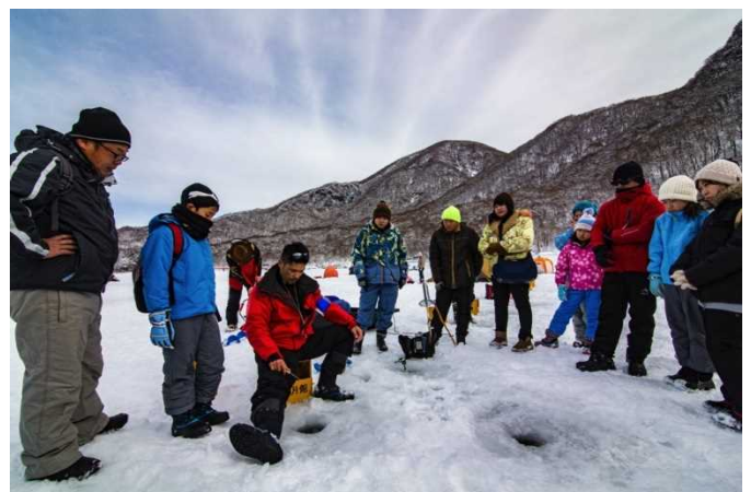
赤城山雪上体験ツアーでのわかさぎ釣り体験