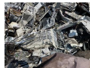
家庭用か業務用か判別困難なエアコン