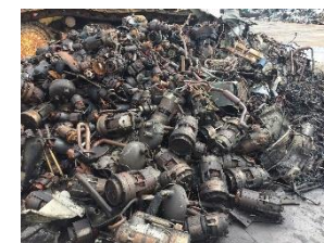
コンプレッサー(産業機械由来と思われる)