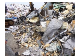
断熱材(フロン含有)が散乱した業務用冷凍冷蔵機器