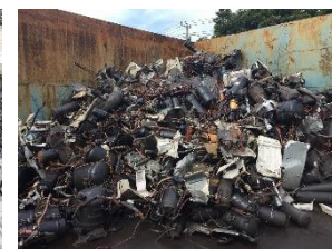
黒モーター(エアコン由来と思われる)