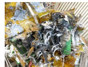
燃えたりチウムイオン電池(配電盤に付属)