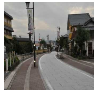
無電柱化・景観舗装