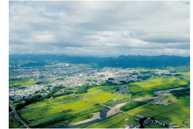
大館ぐるみ温泉郷の全体像