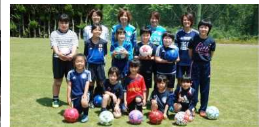
岡山湯郷Belleによるサッカースクール