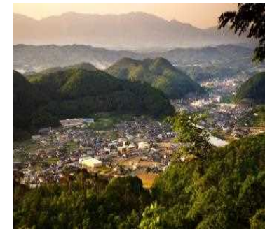
大山展望台から臨む湯郷温泉