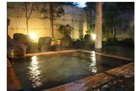
大滝温泉(露天風呂)