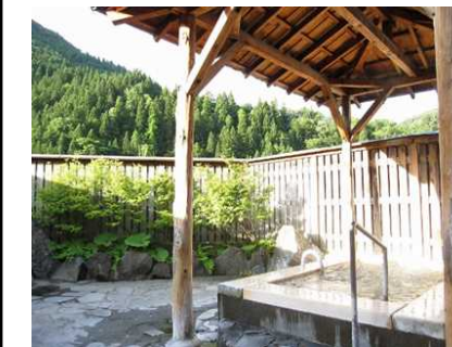
雪沢温泉(露天風呂)