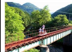
長木溪谷レールバイク