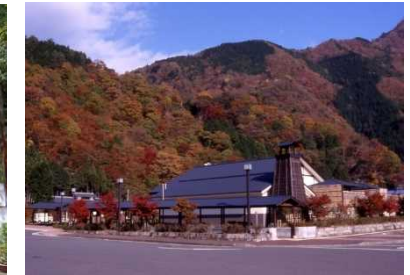
紅葉時期の黄金の湯