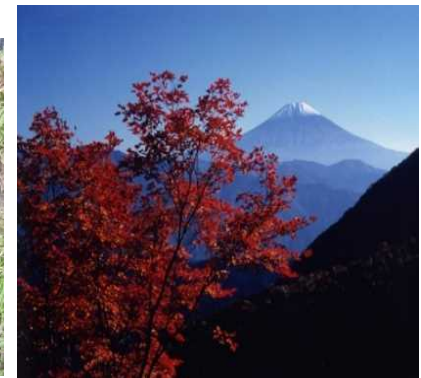
安倍峠から富士山を望む