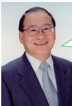
審査委員長 北野 大氏 (明治大学教授)