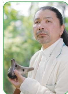
オカリナ奏者 宗次郎