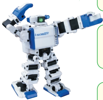
i-SOBBOT タカラトミー アイソボット